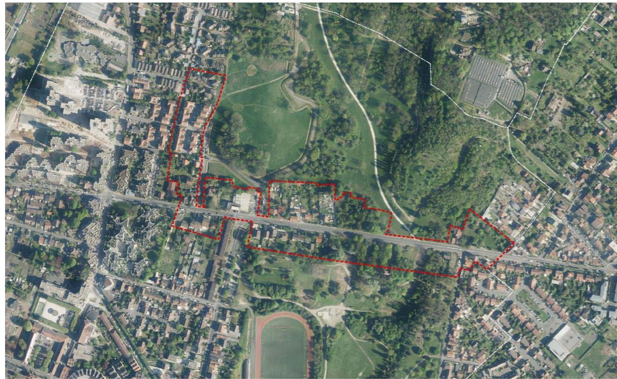
Butte Pinson, vue satellite et périmètre de l'OAP