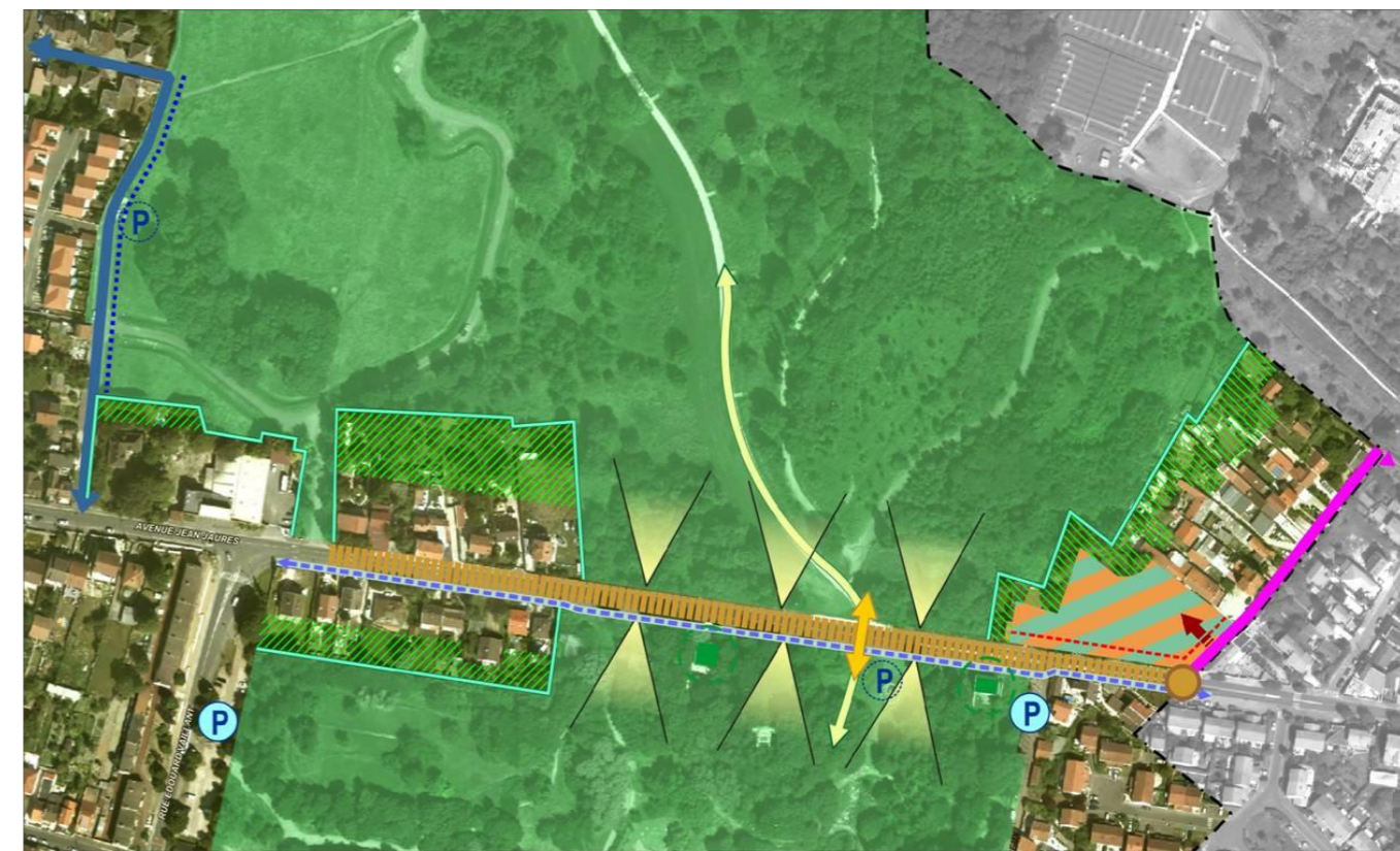
Schéma des orientations d'aménagement pour le secteur

Afin de préserver des vues dégagées sur les deux parties du parc depuis l'avenue Jean Jaurès, tout ouvrage, installation ou construction n'obèrera pas ces cônes de vues représentés sur le schéma de l'OAP.